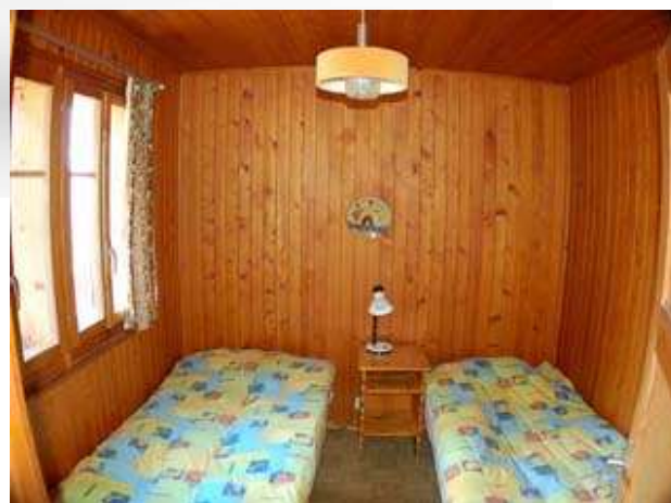
Chambre à 2 lits (A)