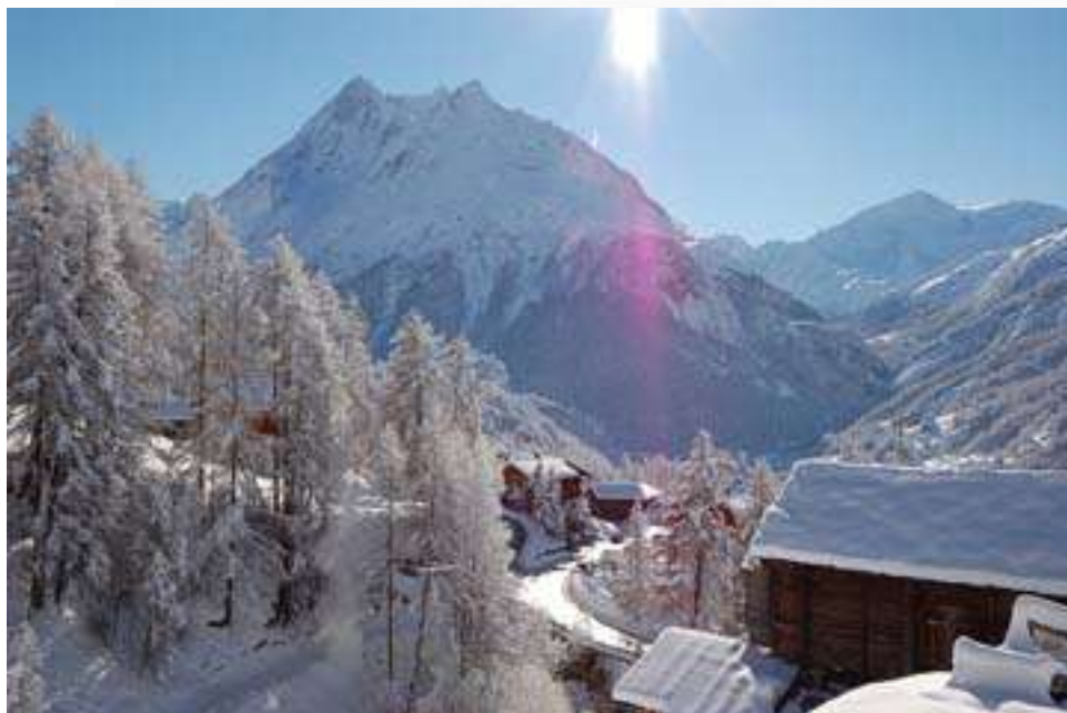
La maison vue du haut. En arrière-plan, les Dents de Veisivi et le Pigne d'Arolla