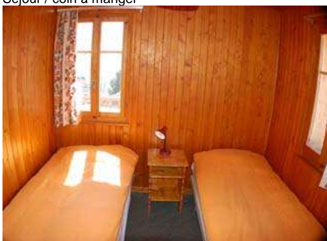
Chambre à 2 lits (B)