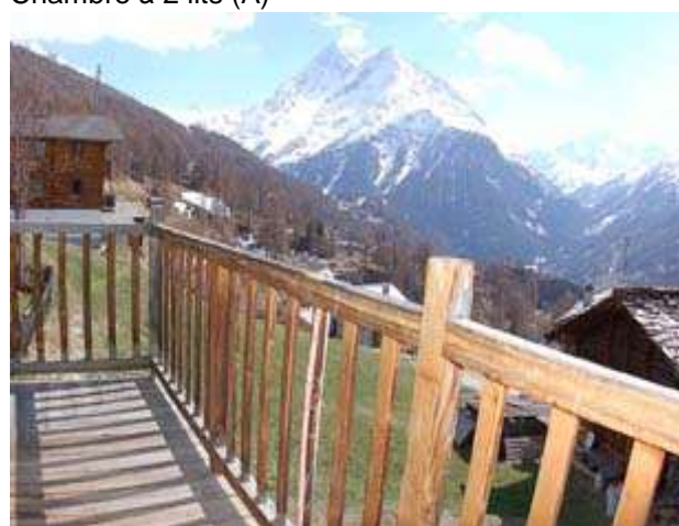
Vue du balcon (Dents de Veisivi et Pigne)