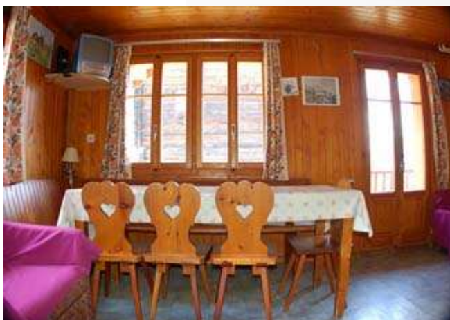
Séjour / coin à manger