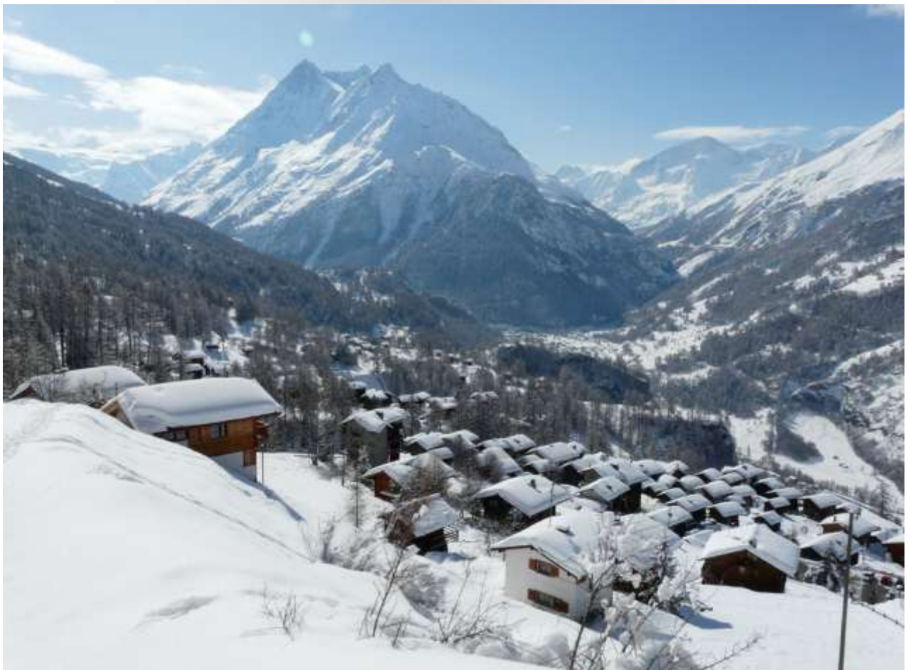
Villaz sous la neige, avec, de gauche à droite, les dents de Veisivi et le Pigne d'Arolla.

Villaz compte quatre-vingt habitants, vivant essentiellement de l'agriculture et du tourisme. Vous serez peut-être le prochain privilégié à découvrir Villaz. L'espace d'un week-end ou d'un séjour, la Famille Gaudin vous propose des logements de charme et fonctionnels : appartements de vacances, bed and breakfast ou chalets de mayen.