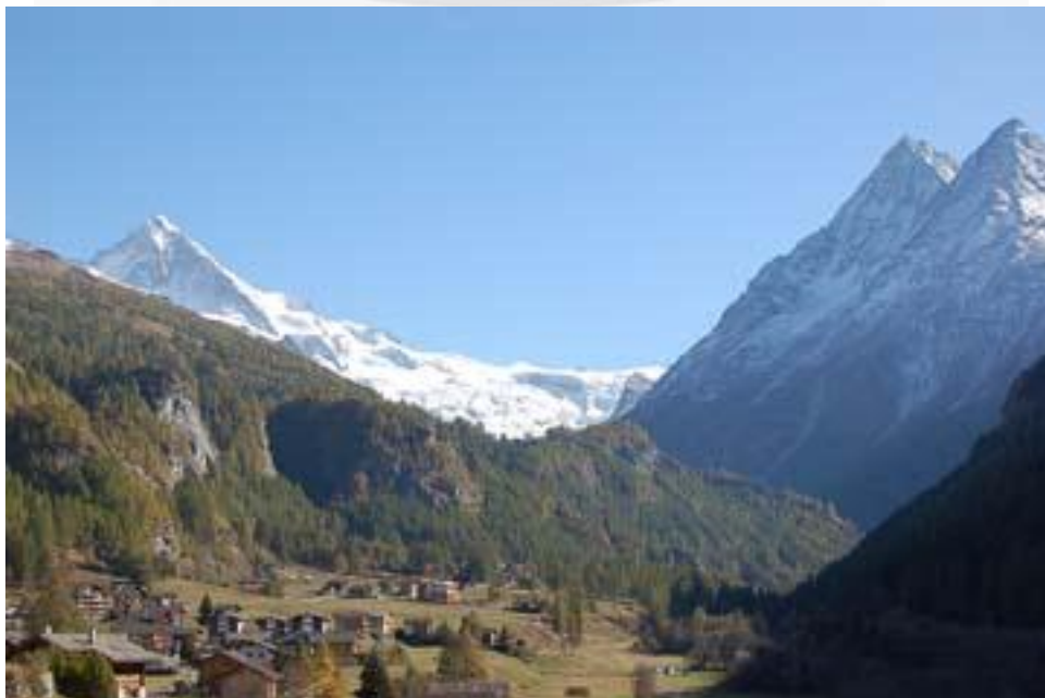
Evolène en été

En hiver, Evolène - Région offre à chaque visiteur un panorama grandiose, plus de 100 Km de pistes remarquables. Aux abords d'Evolène - Région, d'agréables promenades à faire en raquettes et pour les plus aventuriers d'entre vous, le plaisir de l'héliski accompagné d'un guide de montagne.