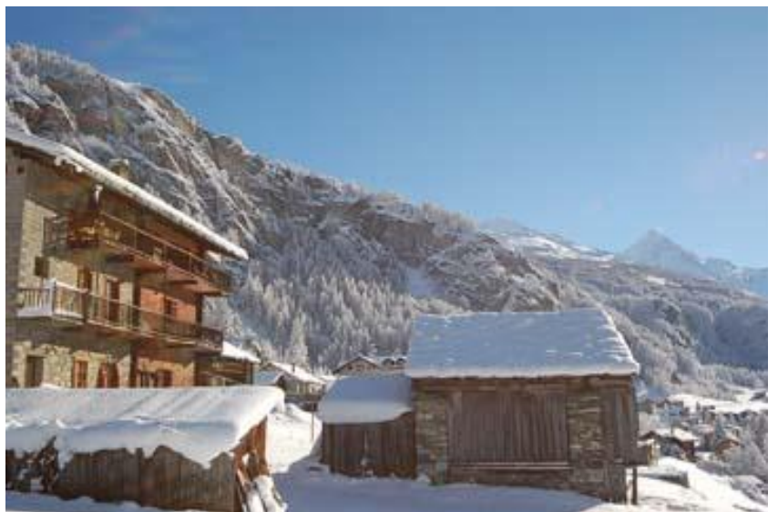
Le chalet du bas