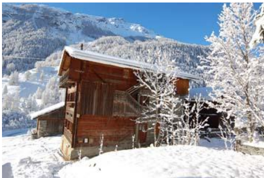
Le chalet vu du haut

1 balcon avec vue imprenable plein sud : vue en direct sur la webcam www.evolene.net