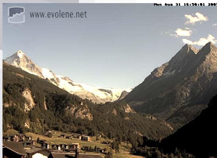
Vue de l'appartement, webcam située sur le balcon