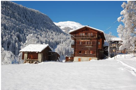
Le chalet de face