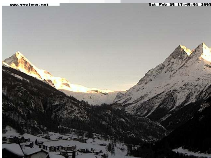
Vue de l'appartement, webcam située sur le balcon